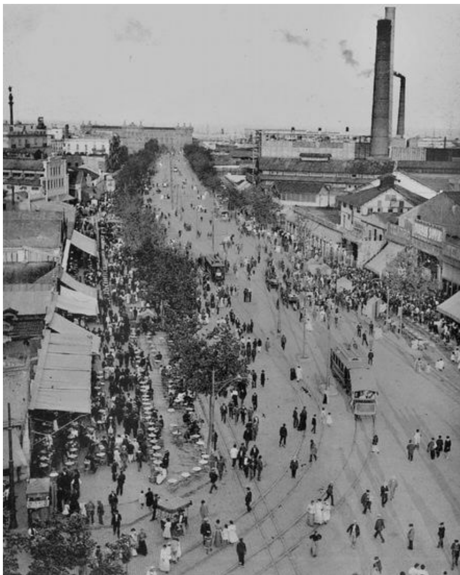
Imatge: Avinguda del Paral·lel. Barcelona, 1905. Viquipèdia.